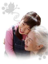
Department of Social Welfare

서울기독교대학교 사회복지전공은 1987년에 개설되어 우리나라 사회복지학의 발전에 기여해왔다. 그 동안 많은 졸업생을 배출하여 사회복지현장 곳곳에서 활동하고 있으며 우리나라 복지사회의 구현을 위해 노력하고 있다.